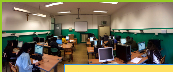
2 lab. informatica