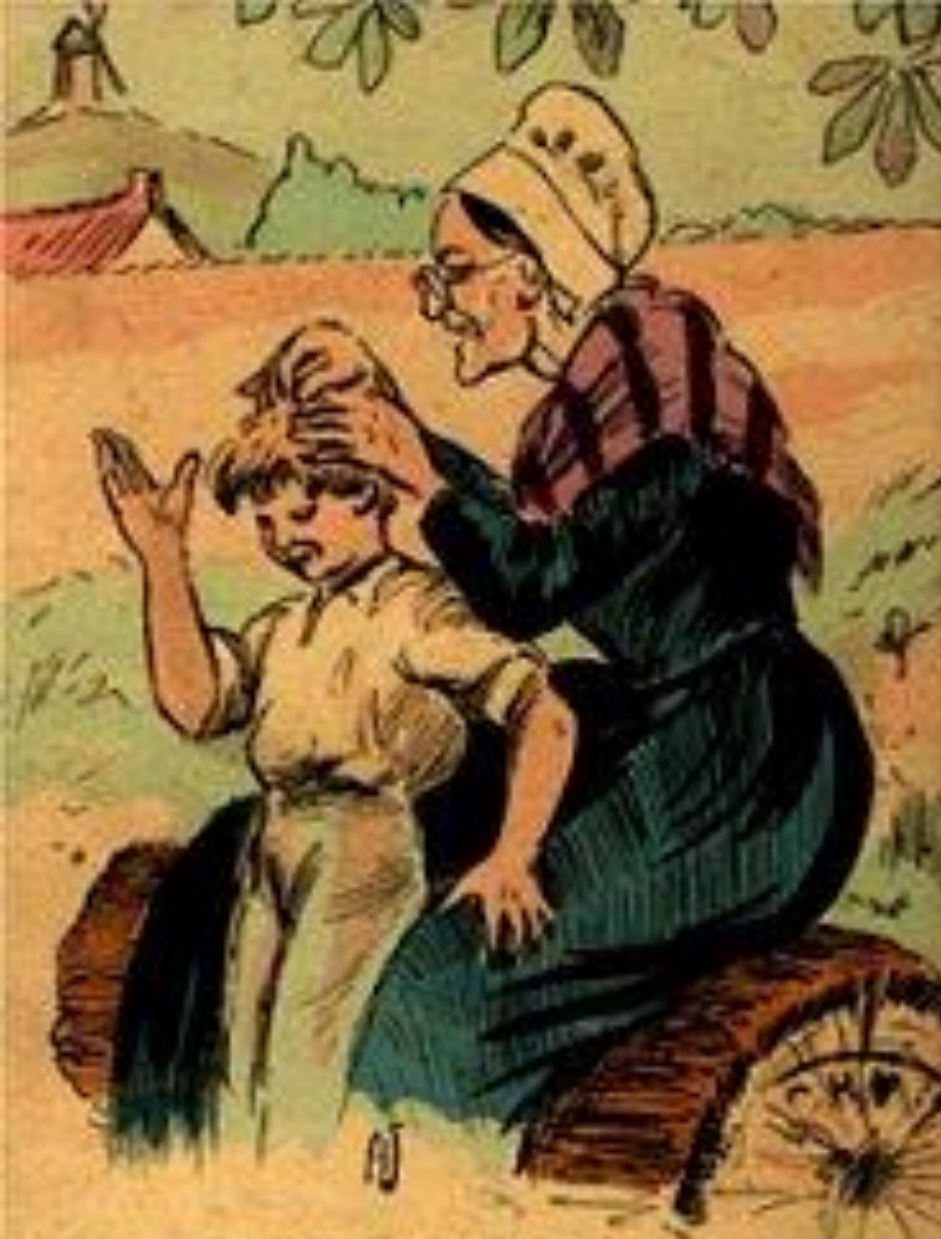
100 - La Grand'Mère et l'Enfant

— Ah ! grand pèren, va ! Jus n'as six ta qu' pe gwen qu' pe gwen — Etienne que j' la fann pèren, va ?